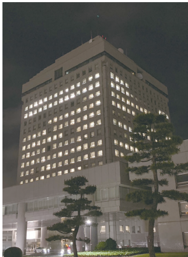
夜遅くまで明かりが灯る県庁。「公務のための臨時の必要」の名のもとに長時間労働が解消されない