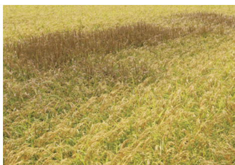
水が行き届かず茶色く枯れた稲穂