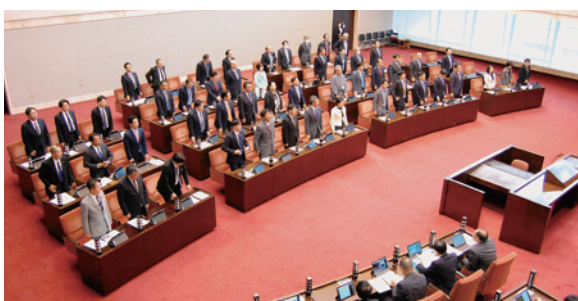
議員報酬等を削減する条例案を全会一致で可決した = 5月22日

最低賃金について政府も骨太方針に「全国加重平均1000円を達成することを含めて(中略)しっかりと議論を行う」と明記する中、未来にいがたから最低